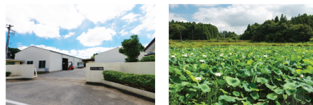
（阿見町近隣エリア）

〒300-1154 茨城県稲敷郡阿見町字上長76-6 TEL：0298-42-9890 FAX：0298-42-6608